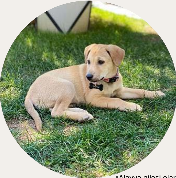
*Alavya ailesi olarak sahiplendiğimiz Lavya'mız.

Otelimizin konsepti gereği, evcil hayvan bulundurulmasına uygun Hayvan dostu bir işletmedir. Otelimizden çıkan yemek artıkları günlük olarak toplanarak belediyenin belirlemiş olduğu hayvan barınaklarına sevk edilmektedir.