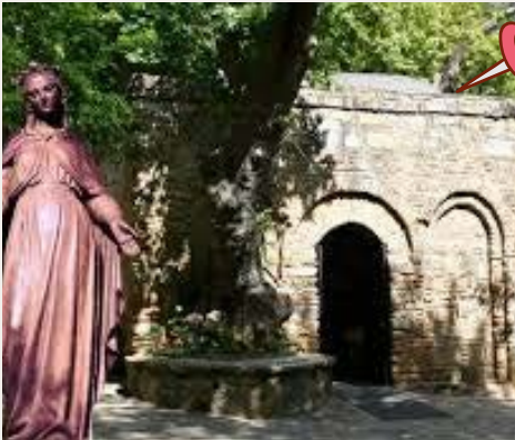
Selçuk Meryem Ana