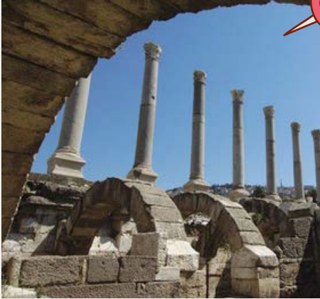
Selçuk Meryem Ana