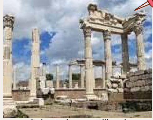
Saint Polycarp Kilisesi