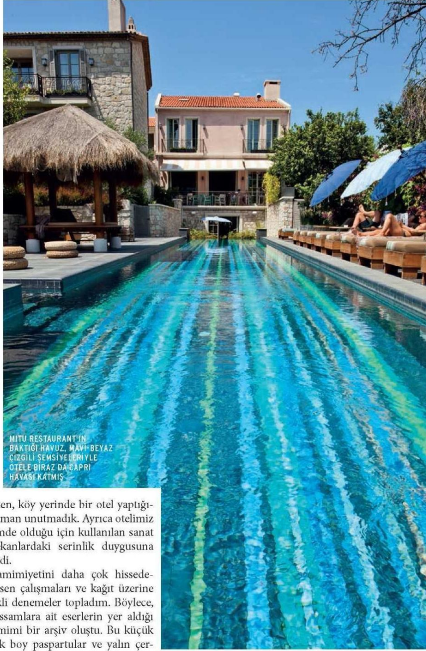
MITU RESTAURANT'IN BAKTIĞI HAVUZ, MAVİ-BEYAZ ÇİZGİLİ SEMSİYELERİYLE ÖTELE BİRAZ DA CAPRI HAVASI KATMIŞ

değer miktarıdır. Klasik öğretiyi ve değerleri kullanıp, eskiyle karışmayacak kadar yeni, genç ama bir o kadar da hep oradaymışlık duygusu veren, çevresiyle akraba mekan veya projelerin sırrı budur.